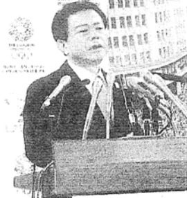
記者の質問に答える猪瀬都知事