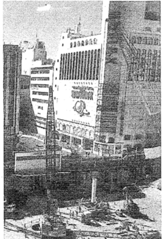
建設が進む東宝のビル開発

の(高速度道路)の有料期 間を延長することも選択 をきちんとしている。 その基本的なスキーム を壊すことはできない。 ただ、45年間できちん と返済し、その後、無料と 理費については今後も徴 収していいという見 方もある。