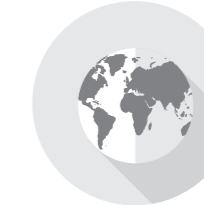
国際税務・ 海外進出