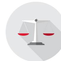
登記・行政手続 弁護士業務