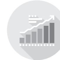
経営・財務・ 企業再生