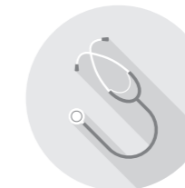
非営利法人 コンサル (公益・医療)